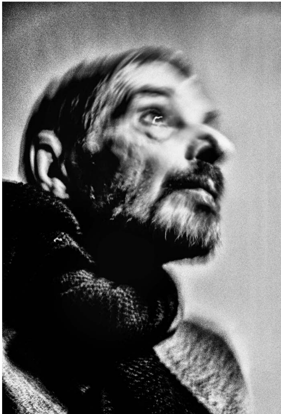
Theo door Lieven Van Meulder.